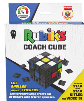
Ach so geht das! Aha- Erlebnis mit dem Rubik's Coach Cube

Wie in aller Welt soll denn dieser Würfel zu lösen sein? Diese Frage braucht ab sofort niemanden mehr umzutreiben, denn: Der Coach Cube-Würfel selbst bringt jetzt jedem, der sich dafür begeistert, die Lösung bei. Nur acht Schritte muss sich der lernwillige Zukunfts-Cuber merken, schon kann er Familie und Freunde mit seiner Fingerfertigkeit und perfekt homogenen Würfelseiten beeindrucken! Als Einsteigerprodukt gedacht, ist der Würfel mit nummerierten Aufklebern versehen, die nach und nach entfernt werden und so die Lösungswege freilegen. Ein ausführliches Booklet liegt bei und erläutert, was sich nicht von selbst erschließt. Wer lieber Bewegtbild konsumiert, findet in der Packung Links zu Erklärvideos für jeden Schritt.