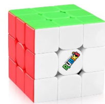
Jetzt aber schnell: Einstieg ins Speedcubing mit dem Rubik's 3x3 Speed Cube

Cuben wie die Weltmeister? Fans der beliebten Speedcubing-Wettkämpfe dehnen am besten schon mal ihre Finger, denn jetzt geht es auf Zeit: Der neue Rubik's 3x3 Speed trainiert Logikmeister ab acht Jahren für die Challenge und bietet den perfekten Einstieg ins Speedcubing. Der Würfel ist besonders leichtgängig und verfügt über einen magnetischen Kern, so dass die Reihen schneller in die gewünschte Position gleiten. Der Widerstand ist dabei individuell verstellbar, damit jeder Cuber für sich das optimale Handling findet und aufs Tempo drücken kann!