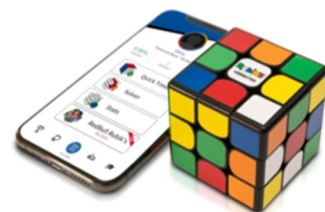
Analog meets App: Der Rubik's Connected X

Via Bluetooth verbindet sich der neue Connected X Zauberwürfel mit der passenden App auf dem Handy und hebt die Cubing-Erfahrung von Fans ab acht Jahren auf ein neues, digitales Level. Natürlich zeigt die App dem Anfänger einen Lösungsweg mit Schritt für Schritt Anleitung. Aber die Verknüpfung von analogem Würfel mit digitalen Features kann noch mehr: Die App registriert und dokumentiert beispielsweise alle individuellen Fortschritte und führt so eine Art digitales Cubing-Tagebuch. Außerdem hilft sie bei der Vernetzung mit anderen Rubik's Fans. Online gegeneinander im Cubing antreten? Der Connected X Würfel spielt seinem Besitzer neben vielen anderen Features auch einen Monat kostenlosen Zugang zur Plattform cubing.co ein.